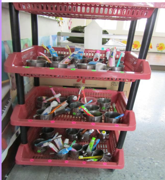
班級牙刷用具擺放整齊