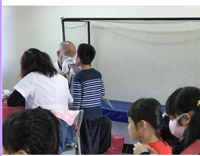
張大嘴巴，檢查一下有沒有蛀牙